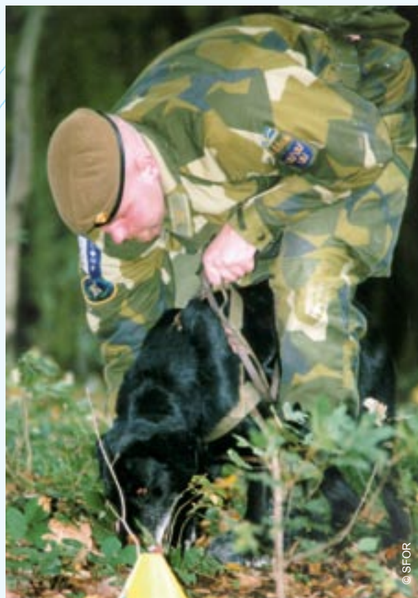
> Шведски миротворец от ЕСФОР с кучето си проверява за мини.

През декември 1996 г. войските на АЙФОР бяха заменени от по-малобройните Сили за стабилизиране (ЕСФОР). Мисията на ЕСФОР бе по-широка – освен да възпрепятства възобновяването на военните действия и да съдейства за подобряване на обстановката за ускоряване на мирния процес,