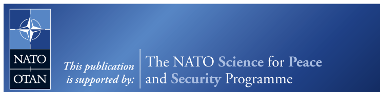
4_SPrg EN Ver